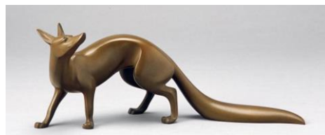
津田信夫《月下妖麗》