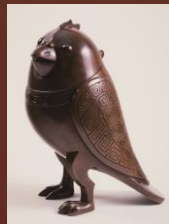
上段 浅井忠 《漁婦》 中段左より 石井柏亭 《舟に居る人》 川瀬巴水 《房州大海》 石井雙石 《一笑百印》 下段 香取秀真 《鳩香炉》