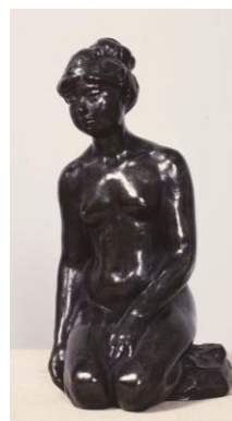
高村光太郎 《裸婦座像》