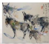
篠崎輝夫《西域古潭》