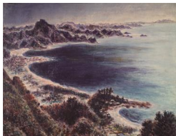
椿貞雄《鋸山から見た房総半島》