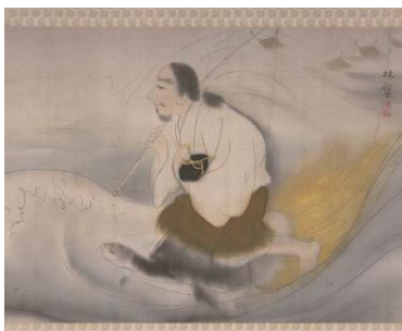
石井林響《浦島太郎図》