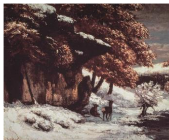
ギュスターヴ・クールベ《雪の中の小鹿》