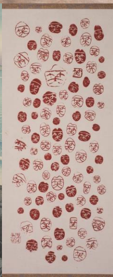
上段 浅井忠 <漁婦> 中段左より 石井柏亭 <舟に居る人> 川瀬巴水 <房州大海> 石井雙石 <一笑百印>