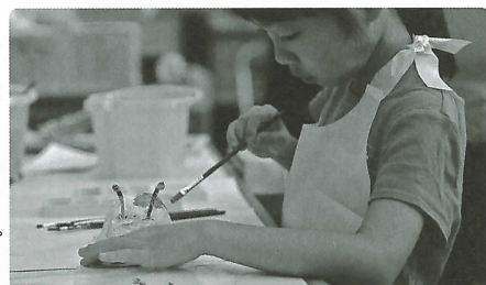
ワークショップ 「海の不思議ないきものをつくる」から