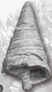
スケンクセンニンガイ