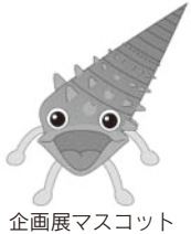
企画展マスコット

最近猛暑の年が多いですね…。日本はだんだんと亜熱帯気候になっている、なんて話も耳にします。でも、太古の時代には、日本中に熱帯～亜熱帯の海が広がっていたらいい!? それは、約2400万年前～約600万年前の、“中新世”と呼ばれる時代のできごと。とくに、1600万年前頃はとりわけ暖かくて、海岸にはマングローブが生い茂っていたことが、当時の化石の研究から明らかになっています。今回の企画展では中新世に生きていたさまざまな生物の化石を紹介し、太古の温暖な気候の中で暮らしていた生き物たちの世界をご覧ください。