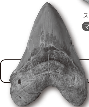
(カルカロドン・メガロドン)