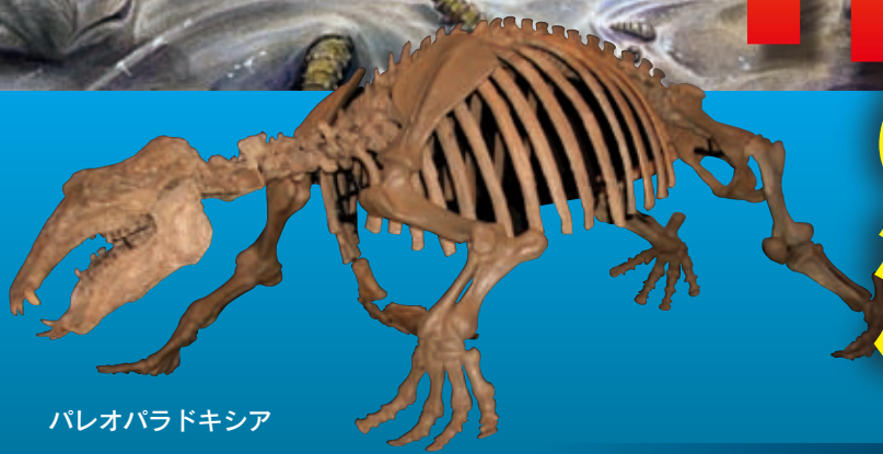
パレオパラドキシア