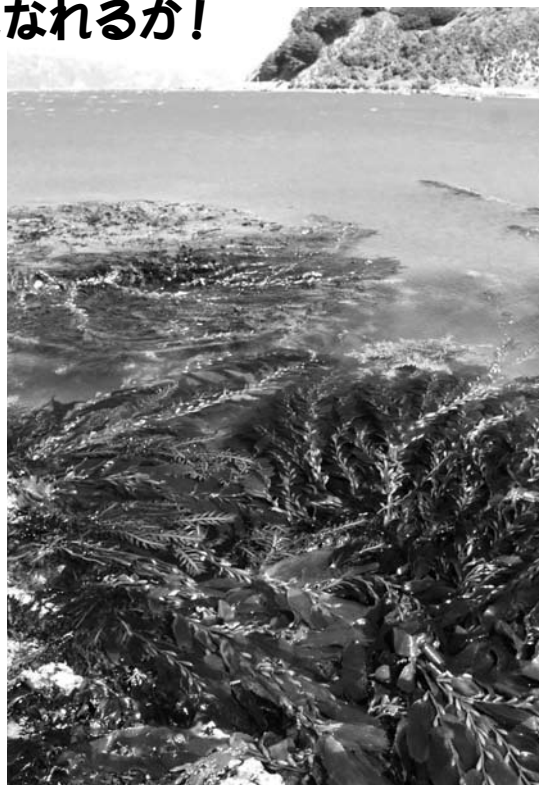
ジャイアントケルプ Macrocystis pyrifera