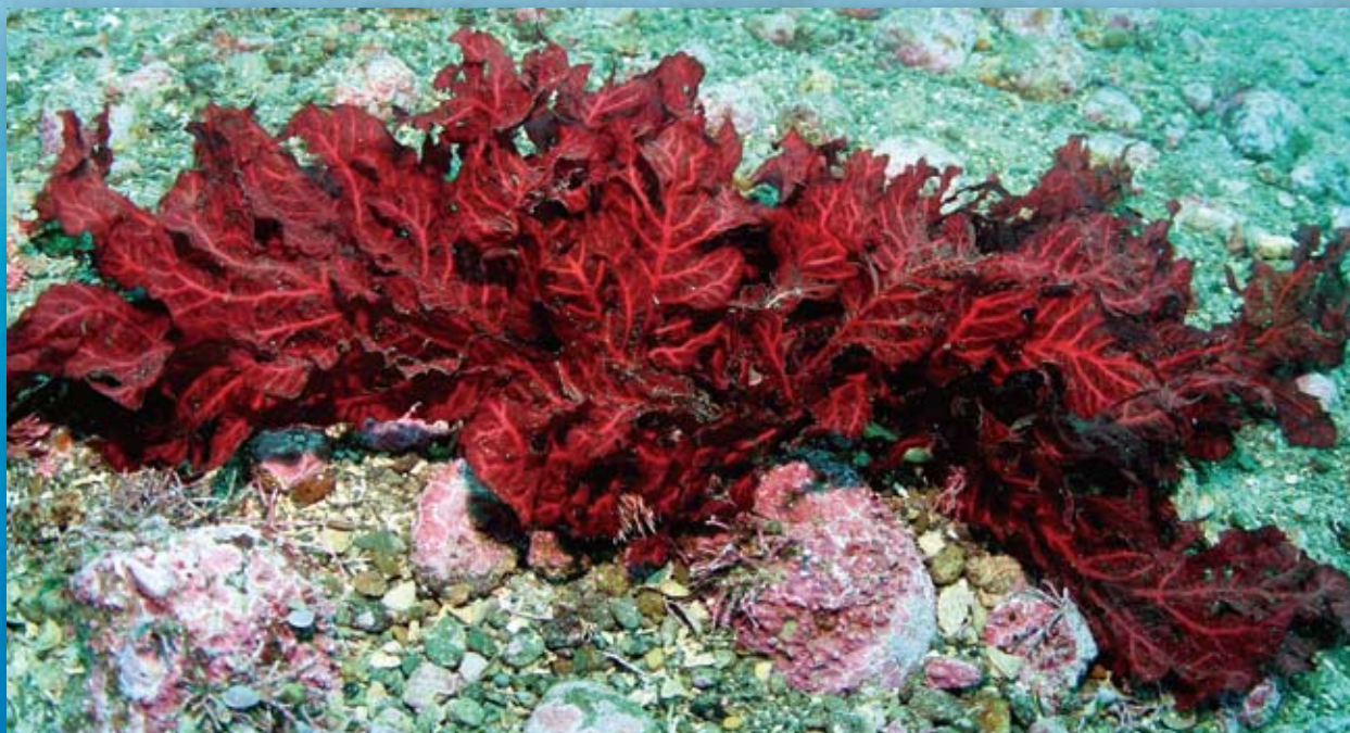
紅藻・コノハノリ Congregatocarpus pacificus