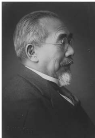
宮部金吾 Dr.Miyabe Kingo