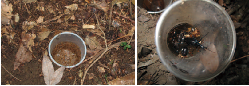
ベイトピットフォールトラップ (BPT)