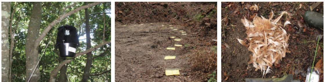
衝突板トラップ (マダラコール)(MCT)