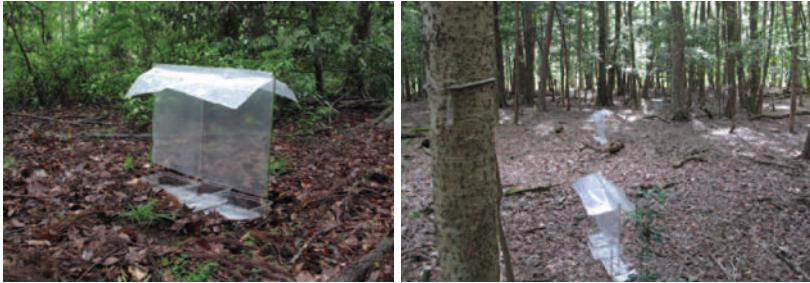
フライトインターセプトトラップ (FIT)