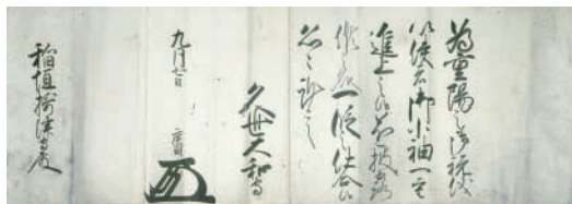
11. 久世広周老中奉書