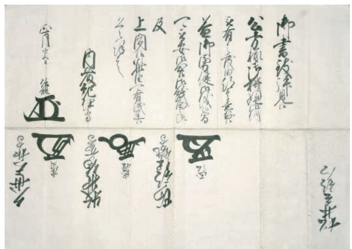
13. 久世広周他老中連署奉書