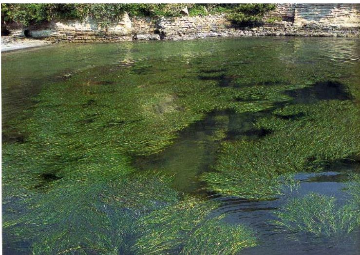
松部の尾名浦のアマモの群生