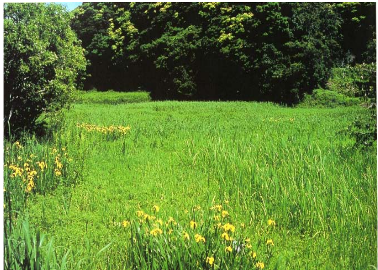
勝浦駅裏の美しい谷津