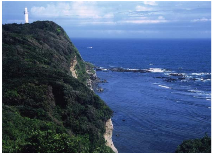
絶壁の上に建つ勝浦灯台と石ヶ浦