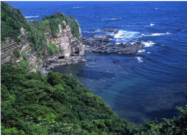
川津の矢の浦の透明度の高い海