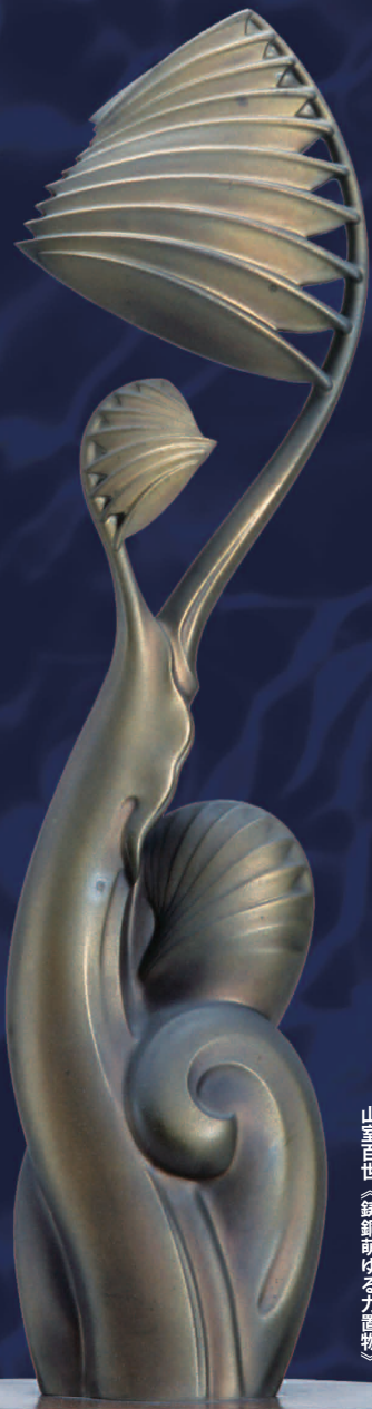
山室百世《鑄銅頭ゆる力植物》

開館時間 午前9時～午後4時30分 休館日 毎週月曜日(1/8◎・2/12◎は開館し翌日休館)・年末年始(12/28～1/4) 入場料 本展の入場料は無料です 千葉県立美術館 〒260-0024 千葉市中央区中央港1-10-1 TEL 043(242)8311 FAX 043(241)7880 http://www.chiba-muse.or.jp/ART/