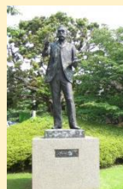
大須賀力《浅井忠像》