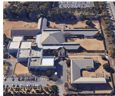
現在の様子