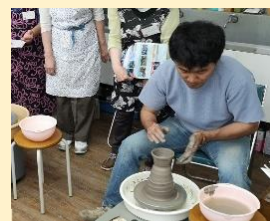
実技講座（陶芸）の様子