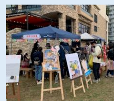
令和3年度の地域イベント参画の様子