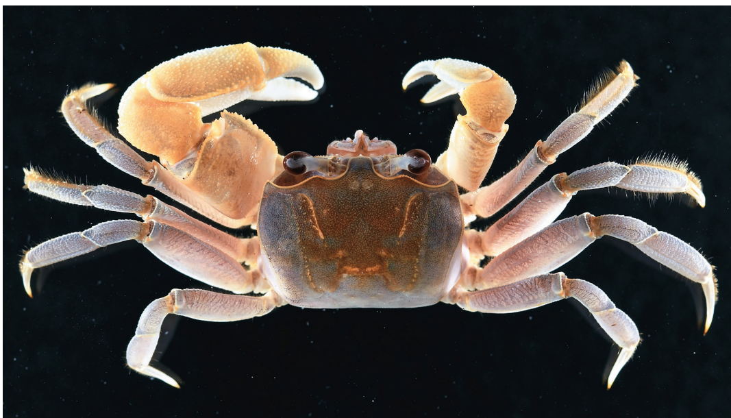
図 2. ナンヨウスナガニ Ocypode sinensis Dai, Song and Yang, 1985. CMNH-ZC 2999, 雄, 背面. 勝浦市部原海岸, 2022 年 10 月 8 日採集.

備考. 調査した標本は鉗脚掌部裏面に擦音装置となる顆粒列を欠くこと, 眼窩下縁に切れ込みがないこと, 尾