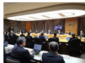
感染症対策本部運営訓練