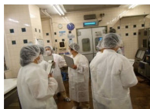
監視員の施設調査