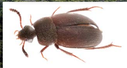
昆虫の新種キヨスミチビシテムシ