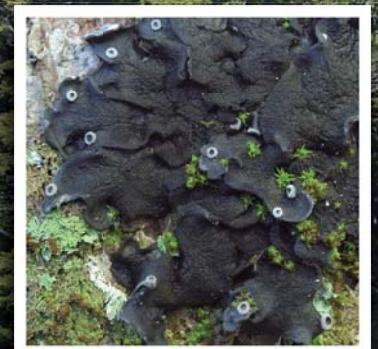
地衣類の新種キヨスミカワキノリ