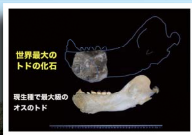
世界最大の トドの化石

世界最大のトドの化石を発見し、新種の生物を発見し、さらに絶滅種を再発見 これらは未踏の秘境ではなく、千葉県房総丘陵を探検した中央博物館の調査団による実績です 地学、動物、植物・菌類の各分野にまたがる重点研究の成果を紹介します