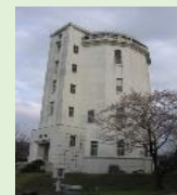
千葉高梁水槽 平成28年度 選定