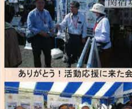
ありがとう!活動応援に来た会員と応援ボランティアのみなさん