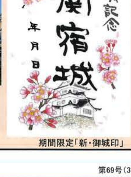
期間限定「新・御城印」