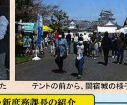
テントの前から、関宿城の様子