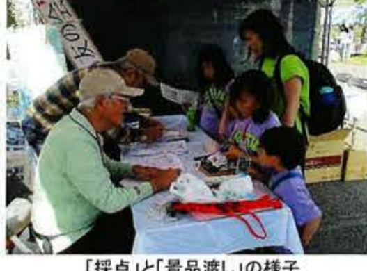
「探点」と「景品渡し」の様子