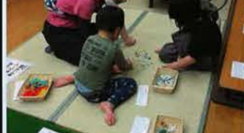
オハジキを楽しむ親子連れ