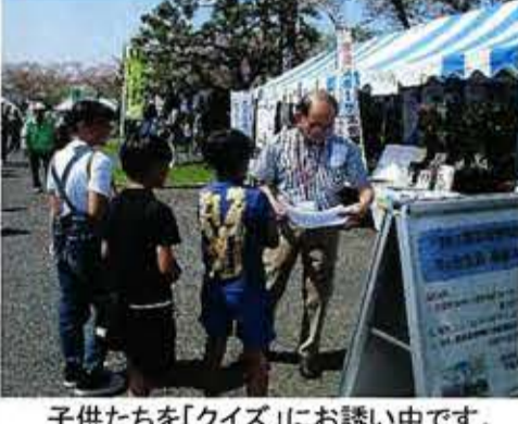
子供たちを「クイズ」にお誘い中です。