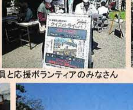
テントの前から、関宿城の様子