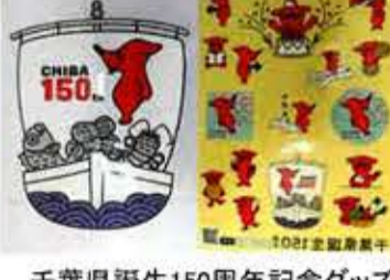
千葉県誕生150周年記念グッズ