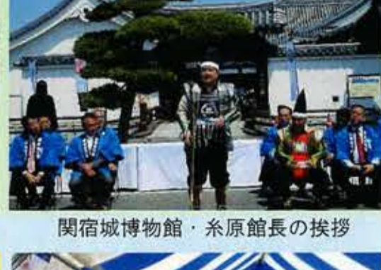
関宿城博物館・糸原館長の挨拶