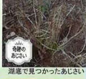
湖底で見つかったあじさい