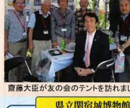
齋藤大臣が友の会のテントを訪れました