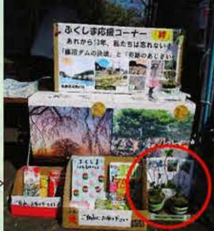
応援コーナーと奇跡のあじさいの苗

友の会のテント内に、今年もコーナーを設けました。今回は、3.11で決壊した福島県須賀川市の「藤沼ダム」の湖底から蘇った『奇跡のあじさい』がテーマです。水の無くなったダムの底から、60年以上眠っていた「ヤマアジサイ」が群生しているのが見つかりました。まさに、『奇跡のあじさい』でした。※里親活動が日本全国に広がり「福島応援のシンボル」の一つになっています。千葉県にも里親がいます。