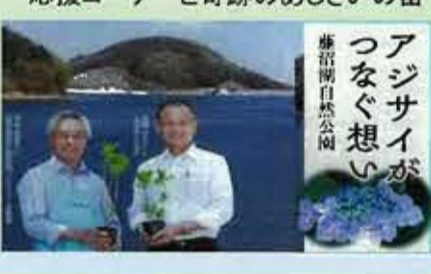
つなぐ思い アジサイが 藤沼自然公園