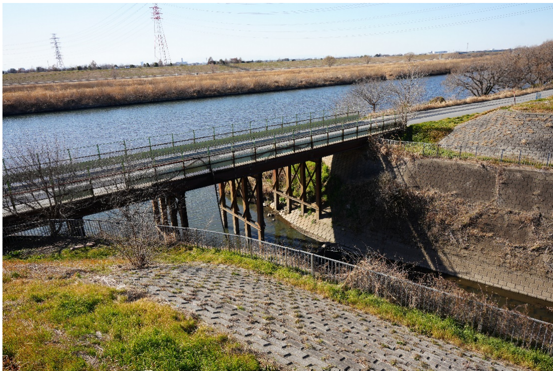
江戸川との合流地点

オランダ人技師ムルデルの指導で明治 23 年（1890）完成しました。一時は年間 37,000 隻の船が航行しましたが、鉄道の普及や洪水の影響で航行する船が減り、昭和 10 年（1935）の洪水により運河としての機能は停止し、現在では親水公園として市民の憩いの場所となっています。