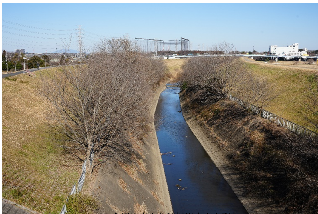
合流地点より利根川方面を望む