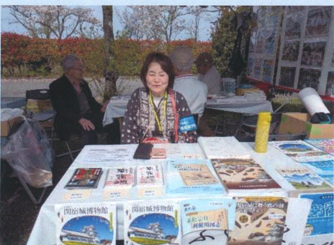
御城印も人気! 売店からの出張販売中!