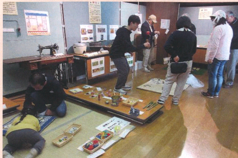
見学と同時に昔の遊びも体験出来る楽しい空間となりました