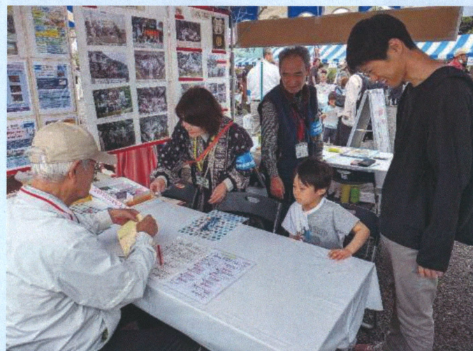
クイズの答え合わせと景品渡し