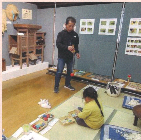
けん玉とオハジキで遊ぶ様子