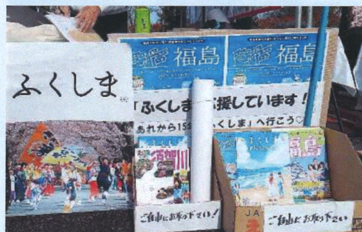
「ふくしま」応援コーナー

★「ふくしま」応援コーナーは、福島県庁と須賀川市の協力で設置しています。3.11の現地体験者として観光PRと復興の様子をこれからも紹介して行きたいと思っております。