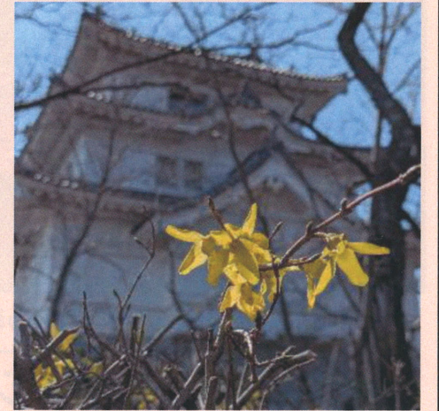
レンギョウと関宿城(日本庭園から)