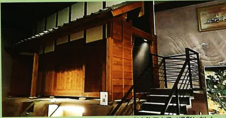
展示品の一部を許可を得て撮影しました。