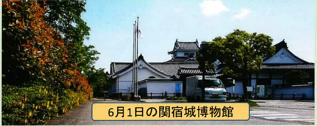
6月1日の関宿城博物館