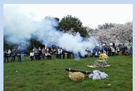
「野田市関宿城さくらまつり」イメージ