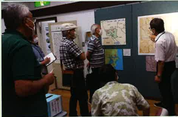
パネル展で説明を熱心に聴く