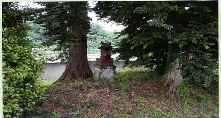
桜山古墳群内 鷺塚古墳