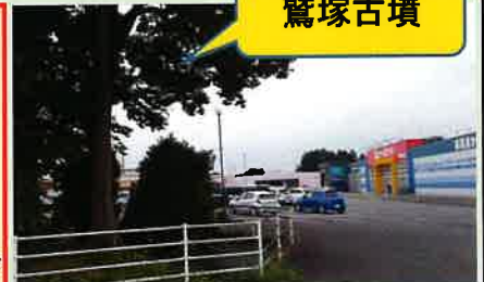
ホームマックとケーズデンキの間!

会員の皆様ありがとうございました。また、ご意見も頂戴し感謝と共に参考にさせていただきます。