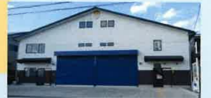
古利根川流灯ふれあい館

友の会では、【会員限定】で「歴史探訪ウォーキング」を企画しました。詳細は別紙にてご案内が会員様に届いていると思います。是非ご参加してみてもいかがでしょうか。 令和4年11月13日(日)小雨決行 東武動物公園駅東口9:30集合