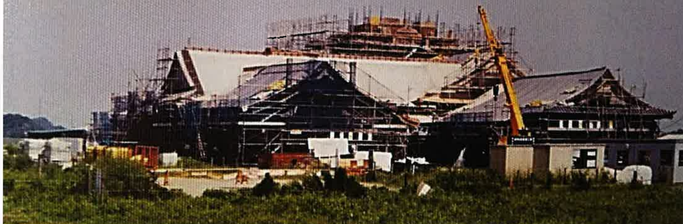
関宿城博物館建設当時の写真 平成6年(1994年9月)当時の現場を見学された会員様もいると思います。