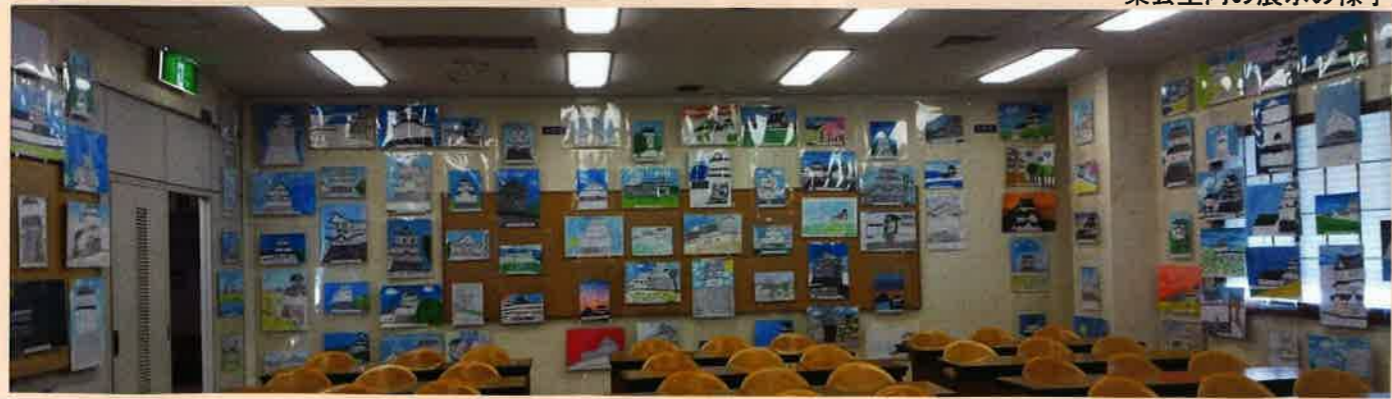
集会室内の展示の様子

集会室の写生画の展示数も増えていることが分かりました。一部の作品は、エントランスに展示されており集会室に来なくても多くの来館者の眼にとまりました。子供たちの絵心も楽しめました。