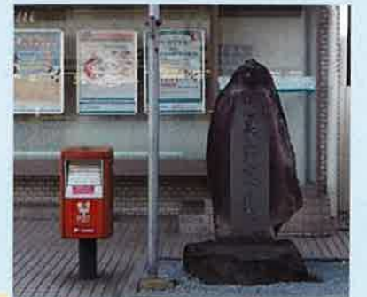
信託銀行の前にあるのが「明治天皇御小休所跡」の記念碑です。(楽しみです)