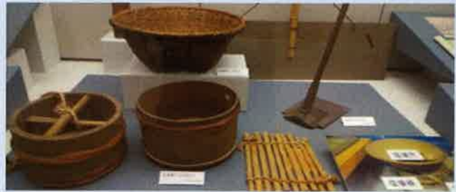
塩づくり道具の展示品

企画展示室に入ると、すぐ目の前に「ドーン！」と塩の塊が現れます。是非、見て欲しい展示品です！