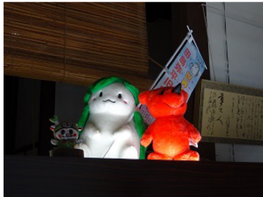
田島弥平旧宅PRキャラクター「くわまる」 といっしょにほっこり