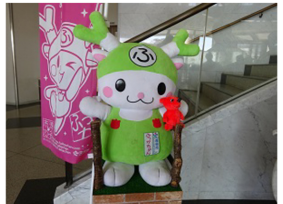
深谷市イメージキャラクター「ぶっかちゃん」といっしょ