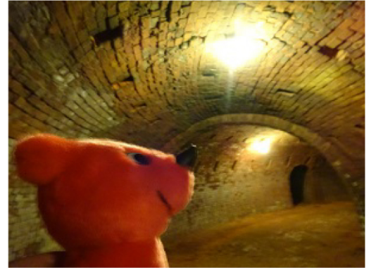
ホフマン輸送6号窯の中だよ。