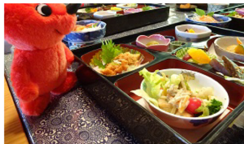
おいしい料理がたくさんだよ。