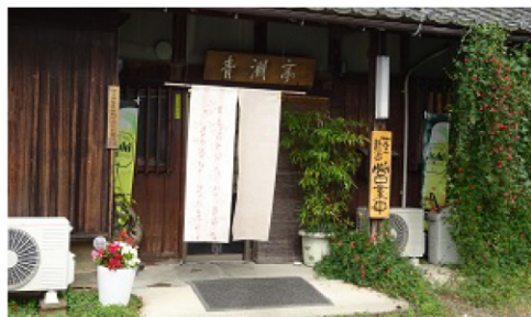
渋沢栄一生地のとおり、青淵亭でお昼ご飯を たべるよ。