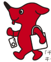
千葉県マスコット キャラクターチーバくん