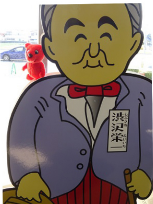
渋沢栄一記念館で栄一さんに会ったよ