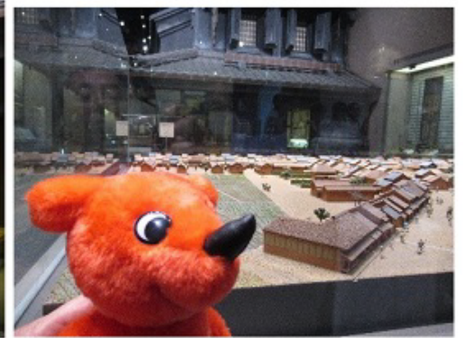
新宿は昔からにぎわっていたんだよね。