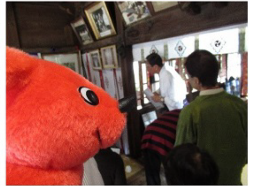
宮司さんがオビシャの説明をしてくれたよ。