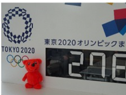
来年が待ちどおしいね。