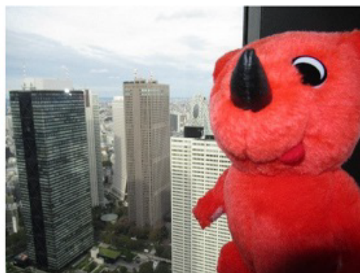
都庁の展望台にも行ったよ。