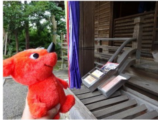
新宿区の中井御霊神社に着いたよ。