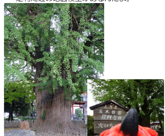
鑱阿寺のイチョウの木はとちぎ名木百選にも選ばれたパワースポットなんだよ。パワー注入～!! コロナ退散！