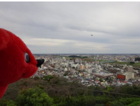
織姫公園のレストラン3階から関東平野がよく見えるよ～