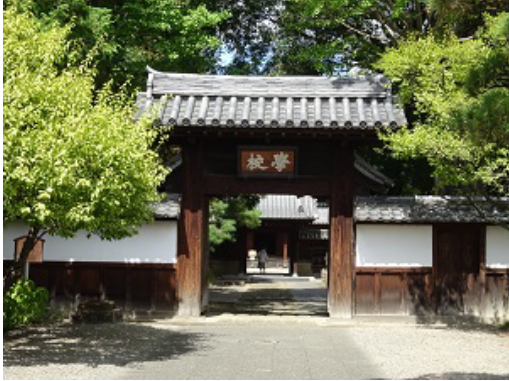
足利学校の前 13時集合だよ～。