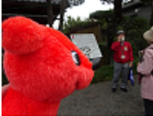
足利学校のガイドさんだよ。コロナ禍初めてのガイドなんだって。