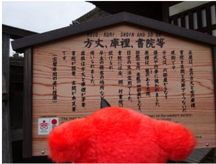
なんだかむずかしい～