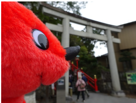
さあ～つぎは！織姫神社に登るぞ～