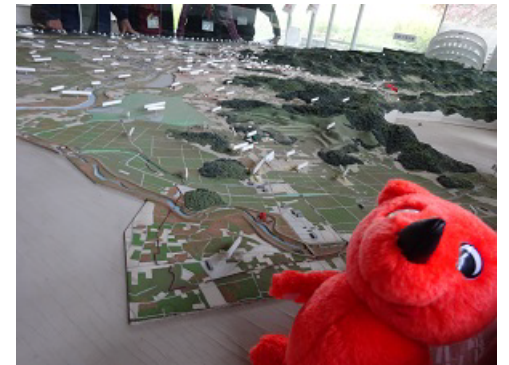
織姫公園内のレストランエントランスには足利周辺の地図模型があるんだよ。