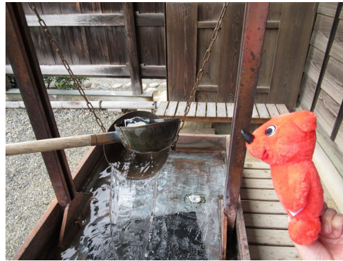
これは宥座之器っていうんだよ。孔子は、「満ちて覆らないものはない」と弟子たちに教えたんだよ。中庸の教え。