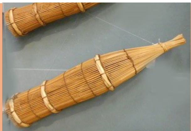
笊(うけ) (川魚漁道具)