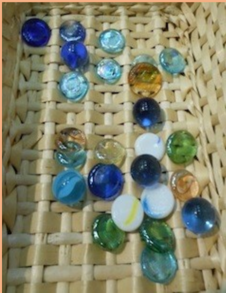
ビー玉・おはじき