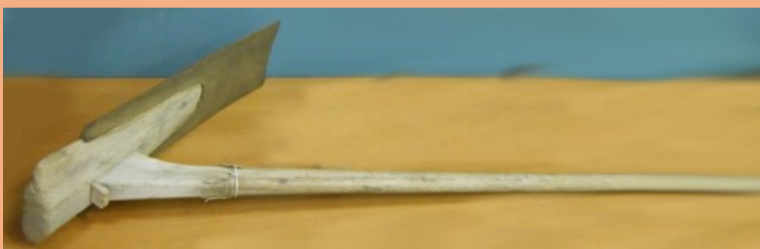
風呂鍬(ふるぐわ) (田畑両用)