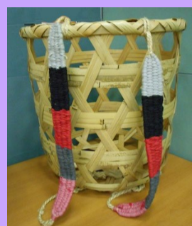
背負い籠 (しよいかご)

高度経済成長期以降、わたしたちのくらははどんどん便利になっていきます。それとともに、大量生産、大量消費、大量廃棄(はいき)時代になります。そして環境汚染(かんきょうおせん)や地球温暖化(ちきゅうおんだんか)が進んでいきます。