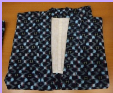
女性用野良着 (上着)