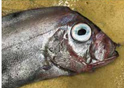
写真:漁師さんから頂いた珍しい海の生きもの (上、マルソデカラッパ・下、サケガシラ)

※マリンサイエンスギャラリーは、毎年異なったテーマで海の生きものを深く掘り下げて紹介する企画展示です。