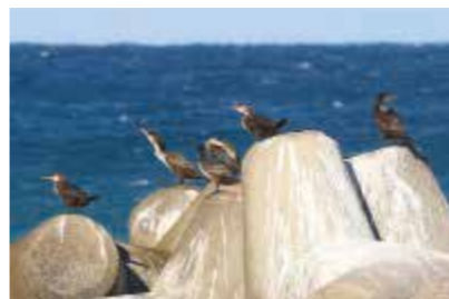
若いウミウの群れ

ウミウは千葉県でも越冬する身近な海鳥です。GPSで渡りを追跡した最新の研究成果や、全国各地における人とウミウのかわりなどを紹介します。