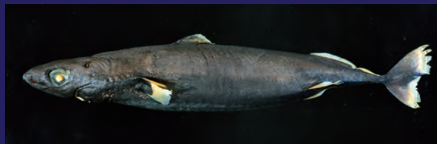
サメの仲間です世界最小クラスのオオメコビトザメ