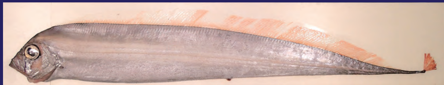
全長1.9 mのサケガシラ