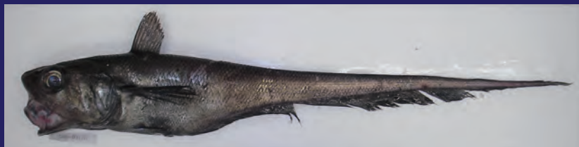
いかつい顔つきでも実は美味しいテナガダラ