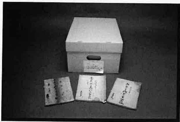
久世大和守領分下総国猿島郡長須村文書 1件の関連画像があります。