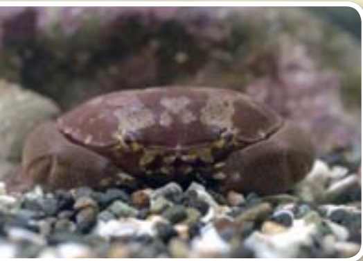
スベスマンジュウガニ