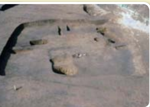
房総最古の鍛冶工房 八千代市沖塚遺跡