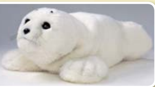
癒し系ロボット「パロ」